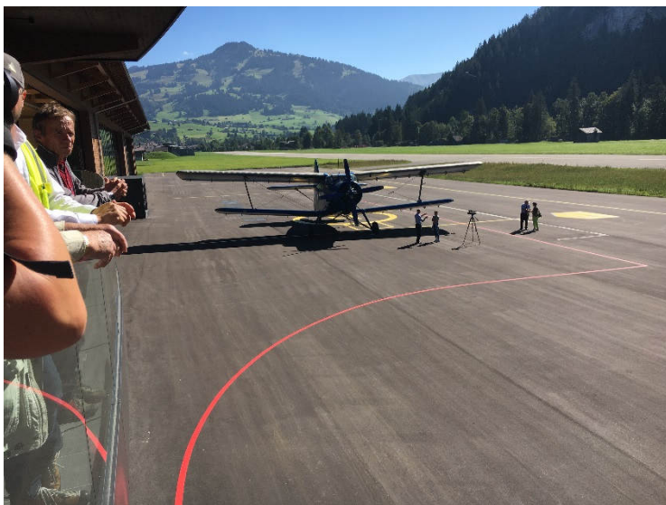
Gstaad-Airport, Neu-Eröffnung 07. Juli 2018