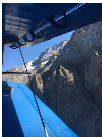
mitten in den Bergen